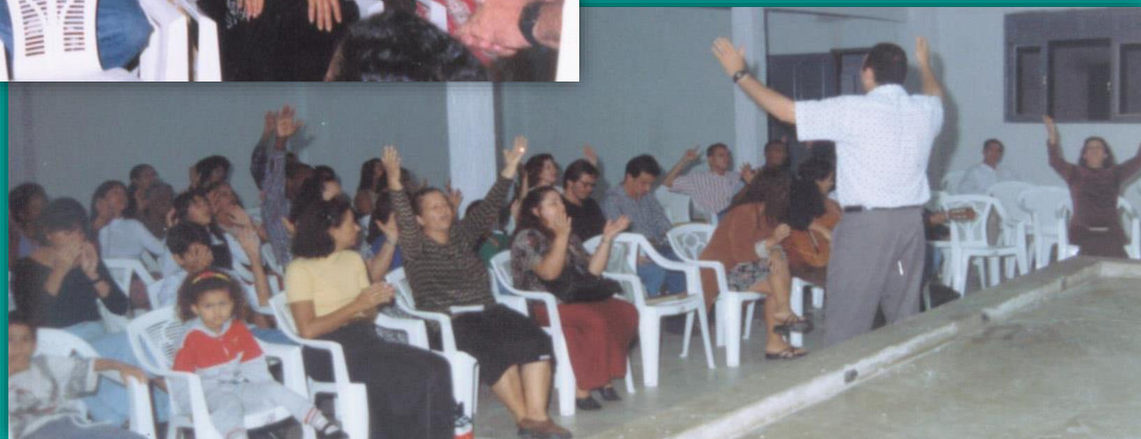
5º Culto: Realizado no templo alugado na Av. Resplendor