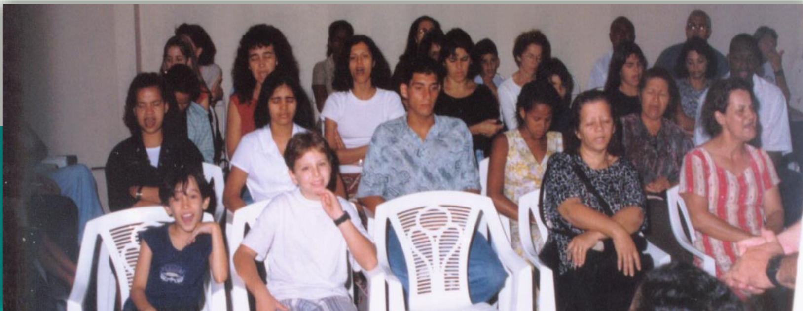
1º Culto: Em Itapoã - no salão de festas do Condomínio Costa Azul