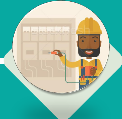
EQUIPE DE ELETRICISTAS