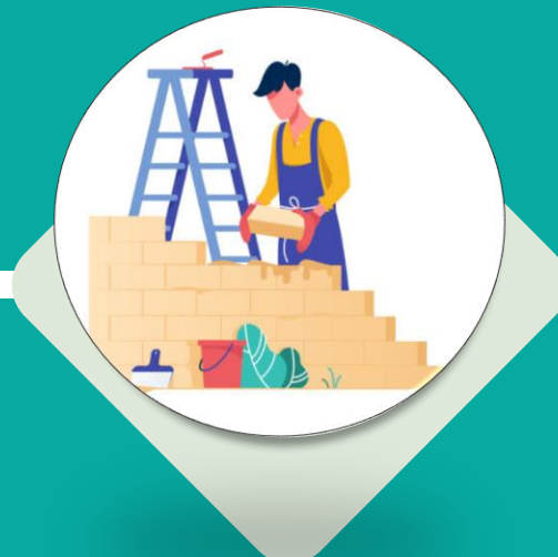
EQUIPE DE PEDREIROS