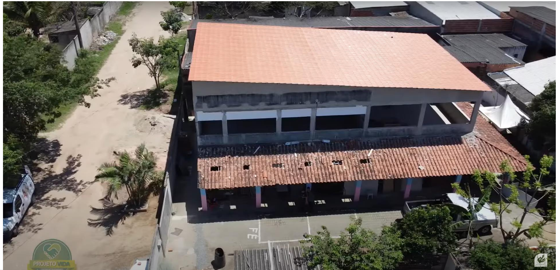
SEDE DO PROJETO VIDA EM RIVIERA DA BARRA